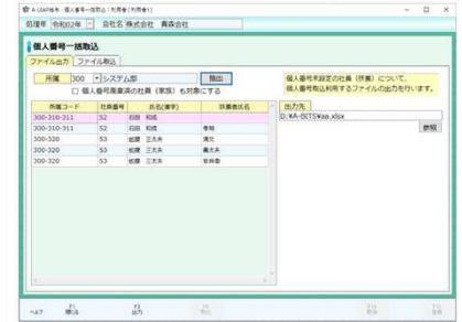
【個人番号一括取込】画面

社員およびその家族の個人番号の管理を一括管理することができます。登録対象者が多い場合や規定年月で廃棄する場合など、個別画面以外から以下のように操作が可能となります。 【個人番号入力(一覧)】 … 社員の個人情報の登録状況を一覧で確認でき、社員ごとに個人番号を設定します。 【個人番号削除対象者一覧】 … 個人番号の削除対象者を一覧で確認でき、選択した社員の個人番号を一括で削除します。 【個人番号一括取込】 … 個人番号をExcelへ入力し、一括取込を行います。一括取込用のExcelは画面から出力できます。